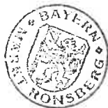
Michael Sturm, Erster Bürgermeister